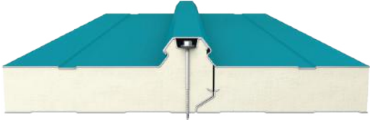
Birleşim Detayı / Connection Detail