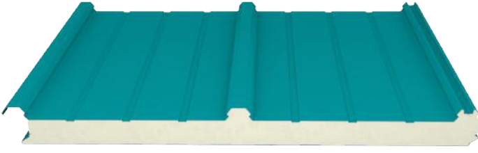
3 Hadveli / 3 Ribs

Being a first in Turkey and developed as a form conforming to Solar Energy Systems (SES) under Panelsan brand, the hidden screw roof panel eliminates the holes drilled for screws during application of roof panels and thereby ensures leakproofing, decreases cost and prevents heat losses. It provides a safe, easy, fast and economic infrastructure for SES installation.