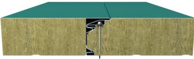
Gizli Vida Cephe Paneli Birleşim Detayı Hidden Screw Wall Panel Connection Detail

Hidden screw wall panels are produced with rockwool and glasswool insulations. Screws are not visible. It provides high heat/ water/ sound insulation and fire resistance. It can be installed both horizontally and vertically. Our panels provide aesthetic alternatives with micro wave and groove surface forms.