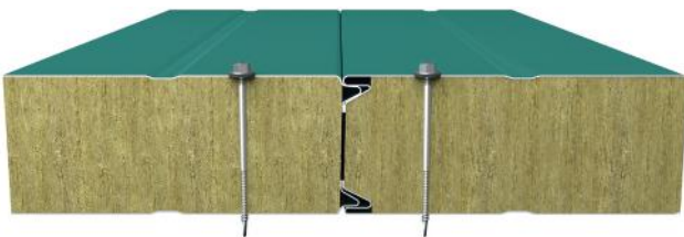
Dıştan Vida Cephe Paneli Birleşim Detayı Outer Screw Wall Panel Connection Detail

Outer screw wall panels are especially preferred for container manufacturing, prefabricated buildings and fire corridors. It provides economic solutions since it is suitable for both vertical and horizontal installation. Ensures protection for your buildings thanks to its heat, water, sound and high fire resistance.